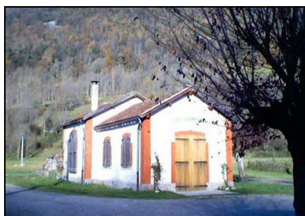
La gare côté cour et côté voies