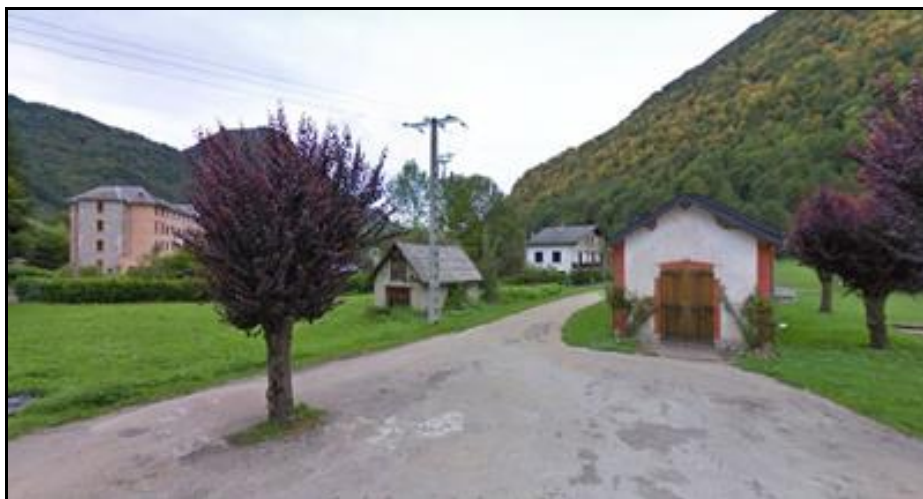
L'arrivée sur la gare d'Aulus