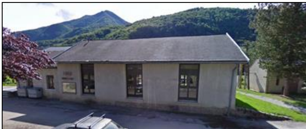
Ancienne gare d'Ercé transformée en foyer communal