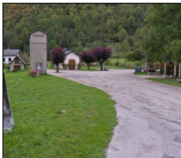
L'endroit où le tram quittait la route pour amorcer la courbe qui mène à la gare, et la fin de celle-ci