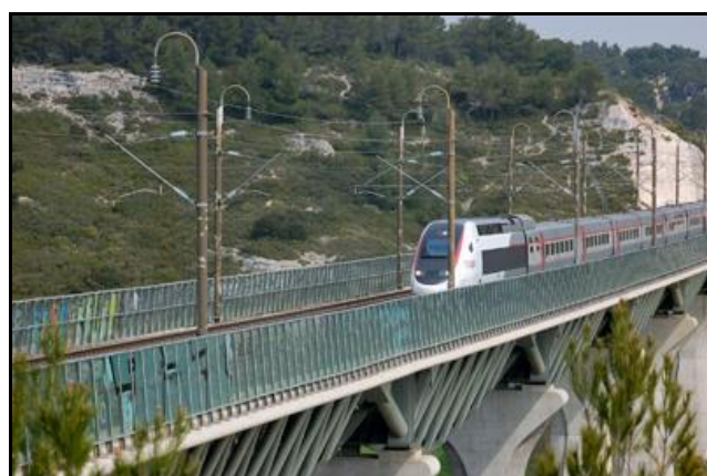
Le dessus du viaduc vu dans le sens et à contresens de la ligne