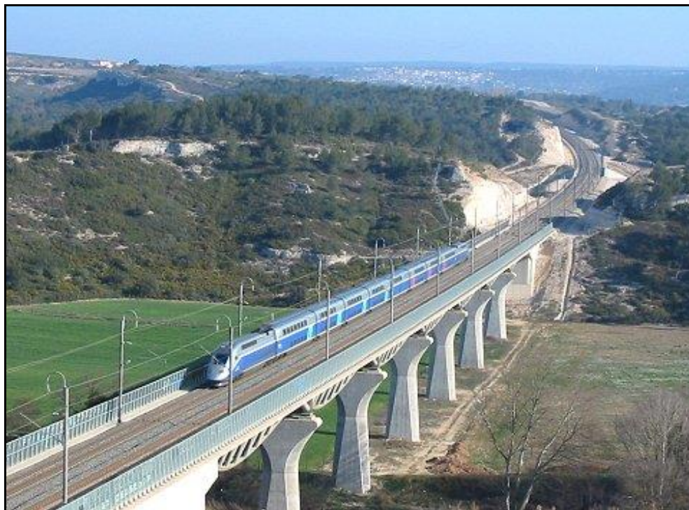
Vue du viaduc prise à contresens de la ligne