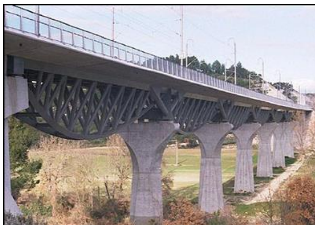
Ci-dessus et ci-dessous, détail du tablier avec ses arcs inversés sur lesquels repose le tablier béton