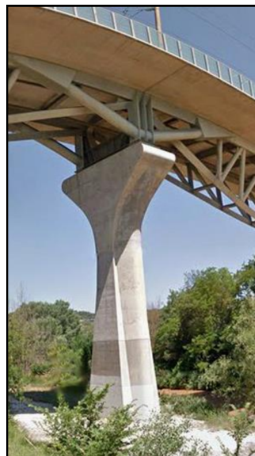
Gros plan sur l'une des piles et détail de l'appui des travées