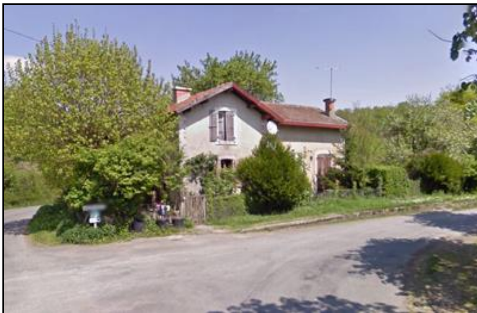
Saint Gervais et son quai qui témoigne de la longueur des trains de l'époque