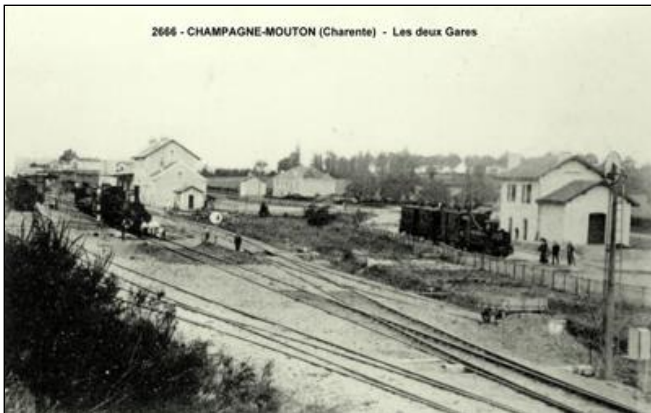
Les deux gares de Champagne : à gauche celle de la voie ferrée normale, et à droite celle du petit train métrique