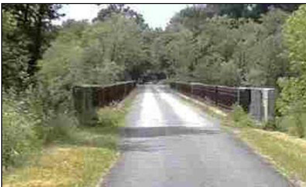
Le dessus du viaduc et ses belles rambardes en fonte