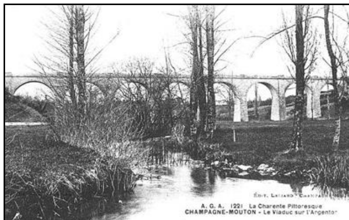
Élément remarquable du parcours, le viaduc de Moulin Robin sur l'Argenton peu avant Champagne Mouton Haut d'une vingtaine de mètres, il compte 9 grandes arches plein cintre