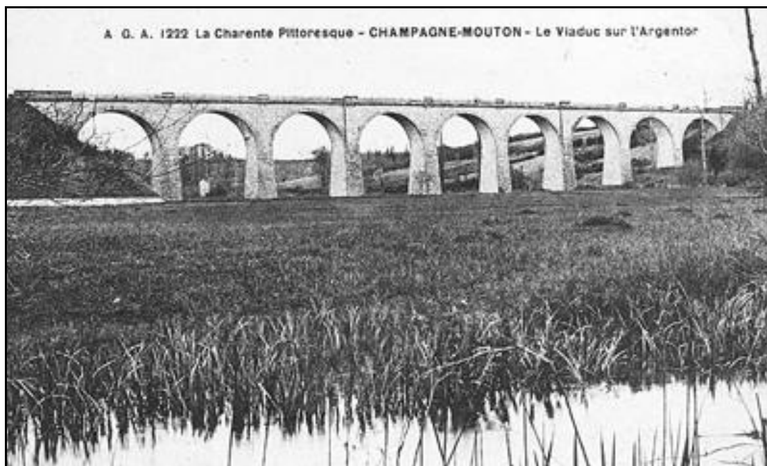
Ci-dessus et ci-dessous, le viaduc hier et aujourd'hui