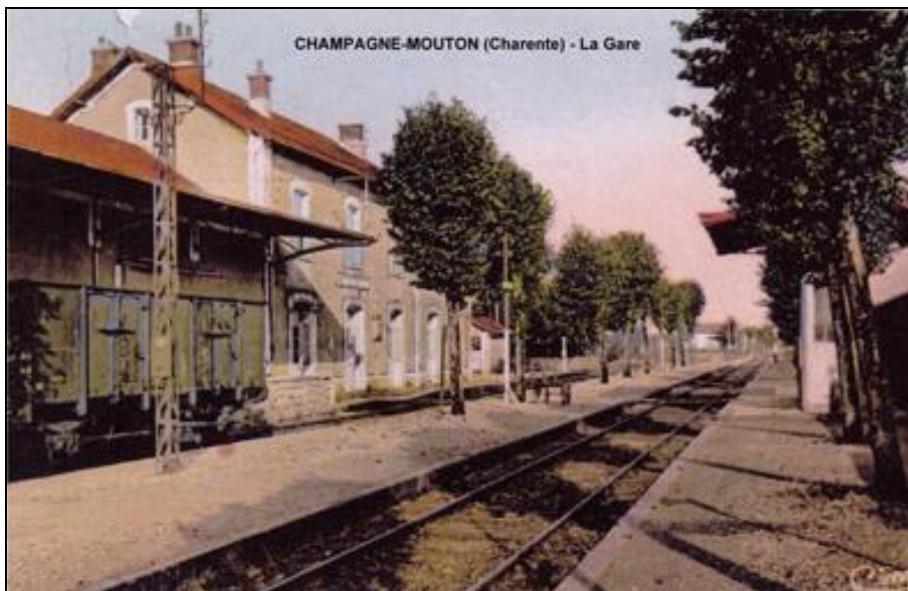
La gare de Champagne peu de temps avant sa fermeture