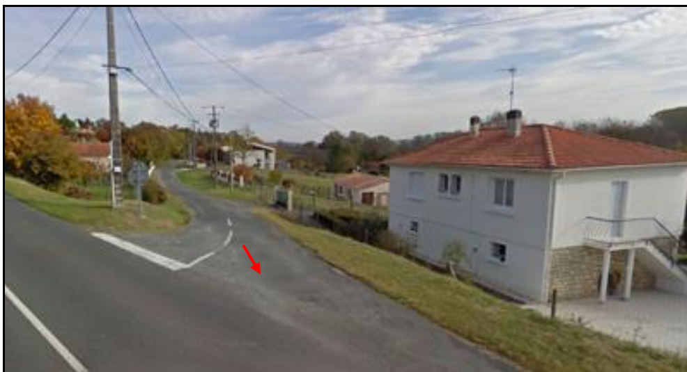
Au premier plan, la RD 114

Si cette fiche comporte des erreurs ou des oublis, merci de nous le signaler. Aidez-nous à la compléter avec vos photos ; merci d'avance.