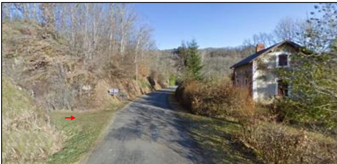
Le débouché de la tranchée et l'ancien passage à niveau de la RD 29

Si cette fiche comporte des erreurs ou des oublis, merci de nous le signaler. Aidez-nous à la compléter avec vos photos ; merci d'avance.