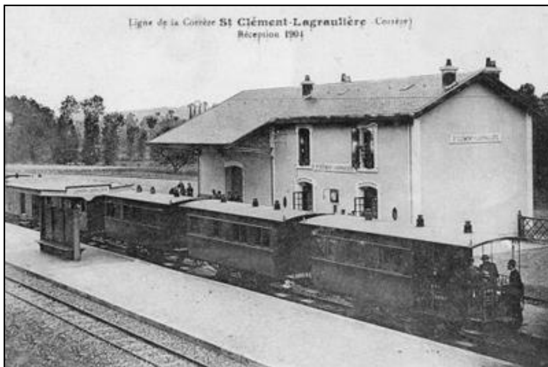
La gare hier et aujourd'hui