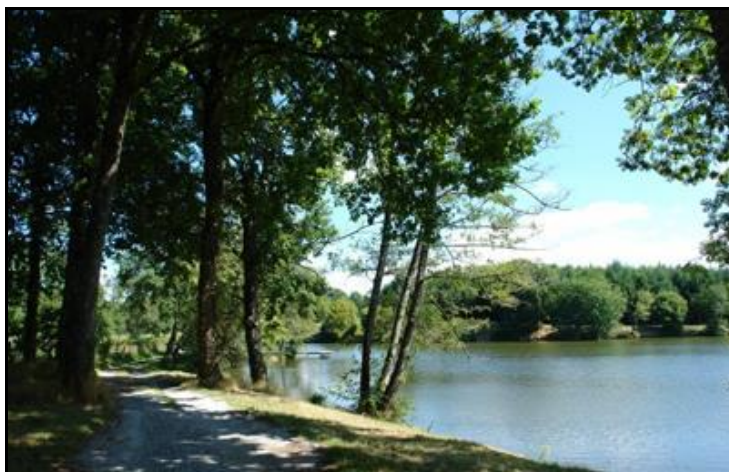
Le long de l'étang