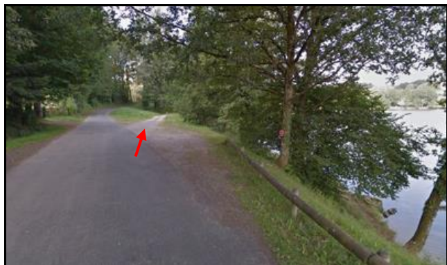
Au niveau de l'ellipse rouge

Ci-dessus et ci-dessous, le parcours longe l'Étang Neuf dont le chemin de rive correspond à l'ancienne voie ferrée