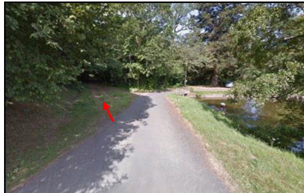
Et au niveau de l'ellipse verte