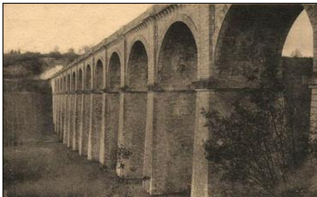
La droite du viaduc vue à contresens depuis la fin de l'ouvrage