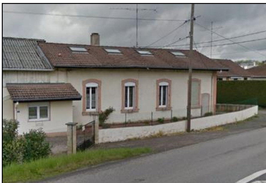
La gare marchandises aujourd'hui accolée à un autre bâtiment