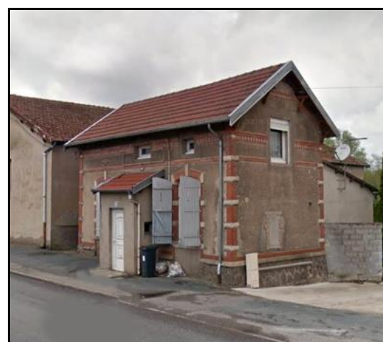
Suivie du terminus voyageurs

Par la suite, ces deux gares ont été remplacées par une gare unique plus importante, mais située plus loin du centre, à l'entrée du village ( cercle rouge ).