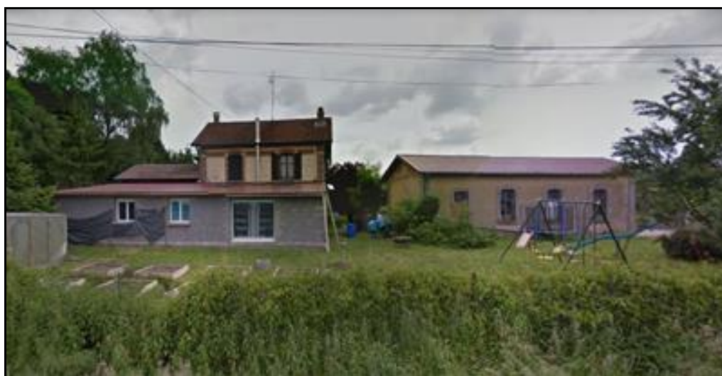
La gare LBB de Badonviller et sa remise

La branche sud de la LBB vers Badonviller montre aussi quelques gares mais plus difficiles à voir que celles de la branche nord. Les amoureux de ferroviaire pourront cependant examiner quelques beaux vestiges à Badonviller où il y avait aussi deux gares Est et LBB voisines.