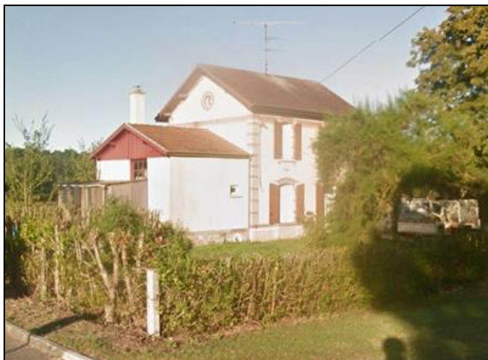
Le côté cour