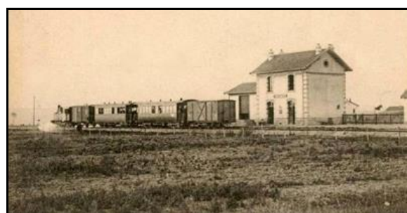
Et deux autres vues anciennes côté cour et côté voies