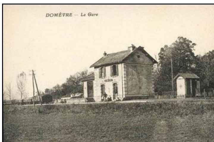
La gare de Domèvre sur Vezouze

Pas de photo actuelle disponible pour l'instant. Il ne tient qu'à vous.