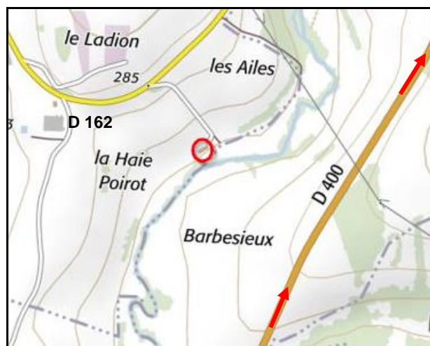
Perdue au bout d'un chemin de campagne dans le fond du vallon de la Vezouze, la halte de Verdenal Elle n'est accessible qu'en revenant de Blâmont par la RD 162

La branche nord de la LBB se terminait à Blâmont, le long de la RD 400. Mais le contexte historique de ses gares est flou. Il semblerait que la ligne se terminait initialement par une gare marchandises (cercle noir) suivie d'une petite gare voyageurs (cercle vert) relativement proche du centre ville.