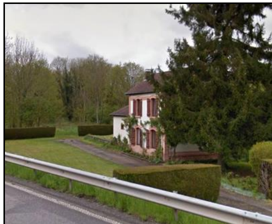
Hier et aujourd'hui, la gare de l'entrée du village

A noter que Blâmont se situait aussi sur la ligne secondaire en cul de sac Avricourt > Cirey sur Vezouze qui dépendait du réseau de l'Est. Il existait donc une gare Est mais pour laquelle il n'y a jamais eu de jonction avec la ligne LBB qui se terminait à l'ouest du village.