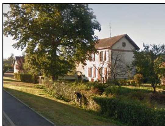
Hier et aujourd'hui, la gare vue sous le même angle