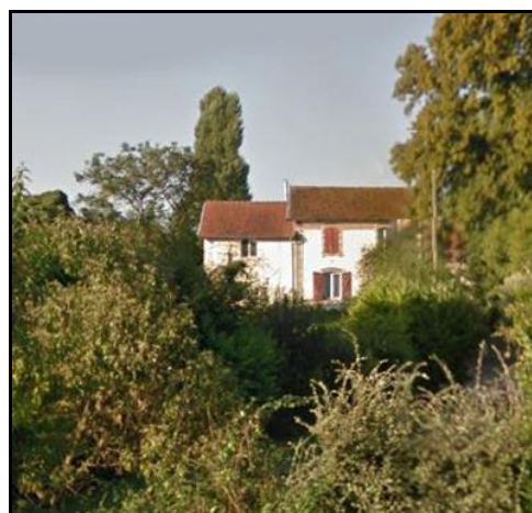
Ci-dessus et ci-dessous, un peu en retrait de la RD 400 et partiellement cachée par d'autres maisons, la gare de Marainviller