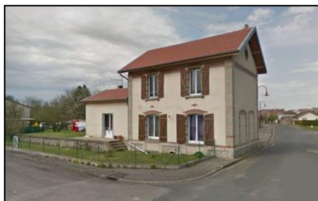
La gare d'Herbéviller côté cour et côté voies avec son joli quai à marchandises