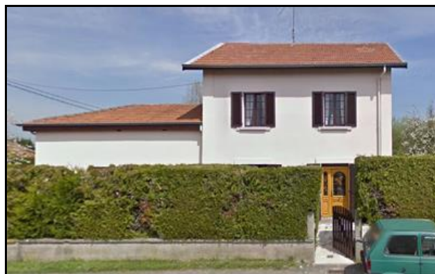
La gare de Croismare, côté voies, hier et aujourd'hui