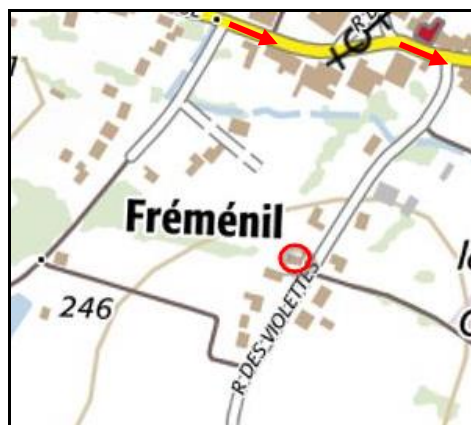
Autres vues de la gare de Fréménil