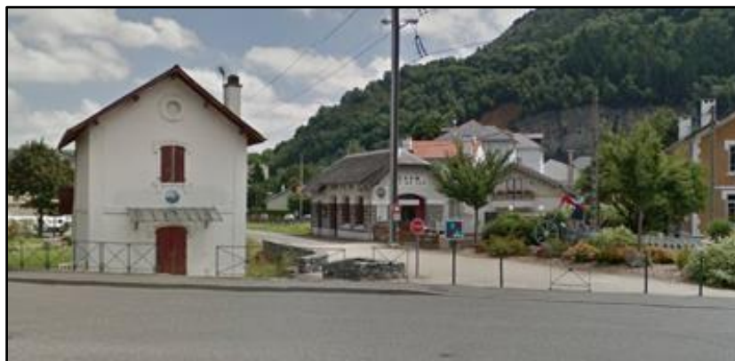
Le passage à niveau de l'avenue du Maréchal foch