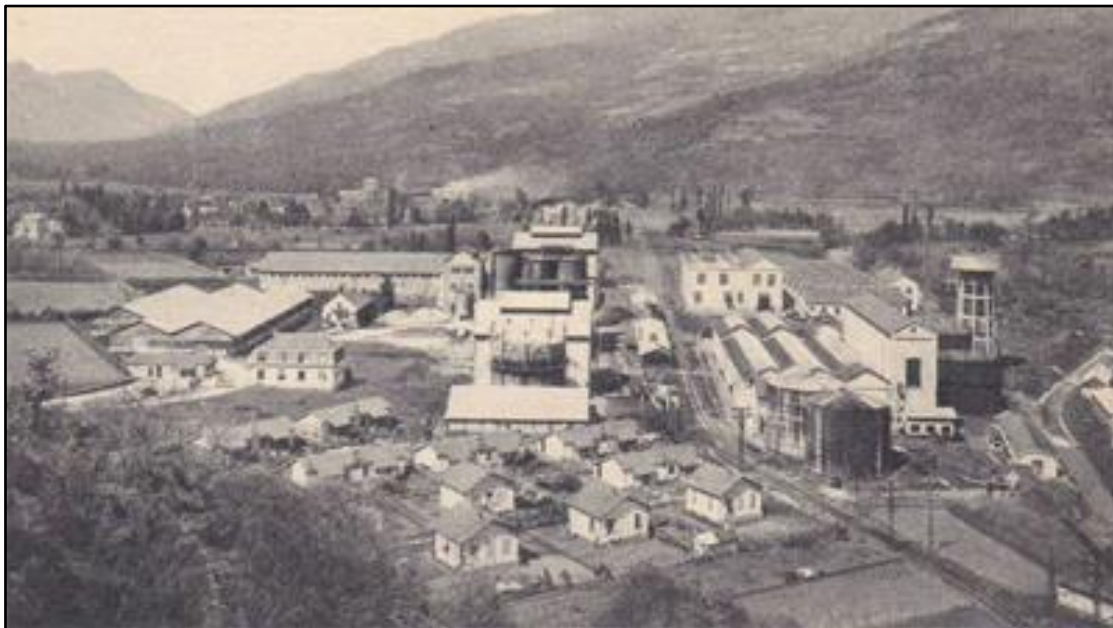
L'usine de Soulom L'arrivée de la voie ferrée est bien visible

La voie ferrée ne s'arrêtait pas à la gare de Pierrefitte. Un embranchement particulier la prolongeait jusqu'aux usines de Soulom Villelongue qui fut un important site était pyrénéen d'électrometallurgie.