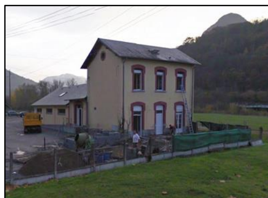
La petite gare de Lugagnan