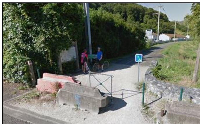
Le début de la voie verte à hauteur du chemin du Tydos