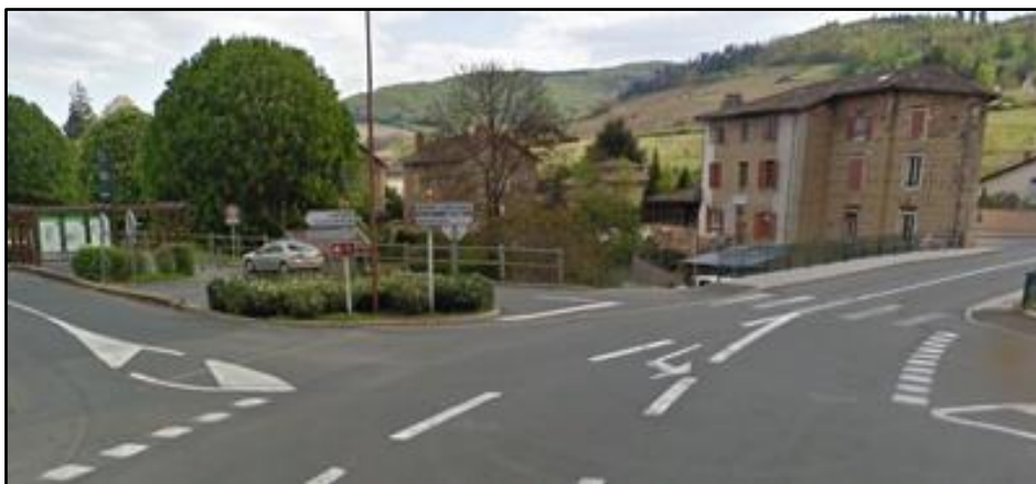
La fin du parcours au niveau du pont de la rue du Général Leclerc La voie verte arrive ici par la gauche, derrière la voiture grise