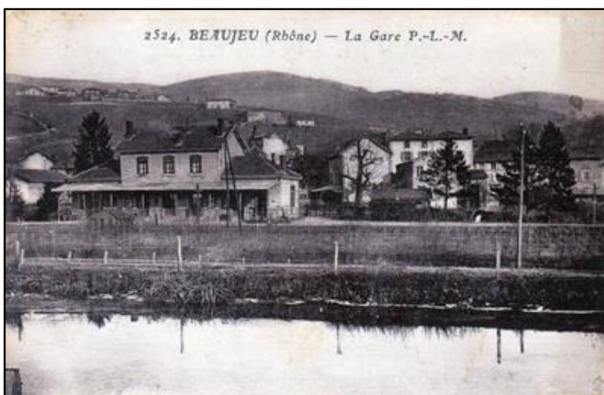
Ci-dessus et ci-dessous, la gare de Beaujeu a disparu pour laisser place à un collège et à un centre commercial Sur la photo ci-dessous, la correspondance avec la petite ligne métrique d'intérêt local