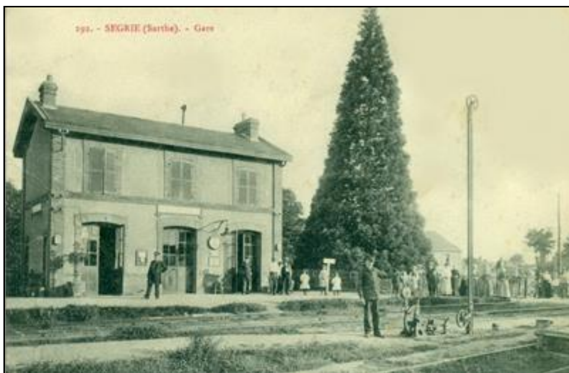
Qu'un magnifique sapin ornait de sa présence