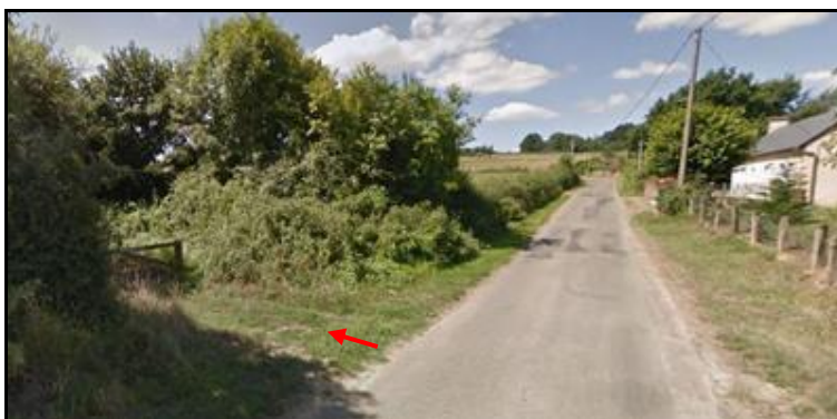
Le début du chemin sur la petite route des Vignes Longues