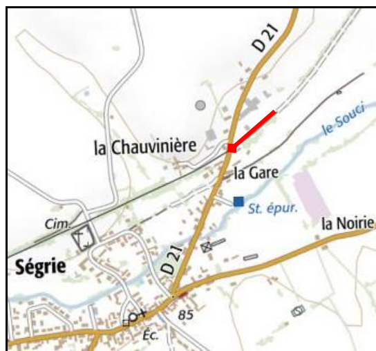
Et la fin de la voie verte sur la plateforme de l'ancienne gare de Ségrie