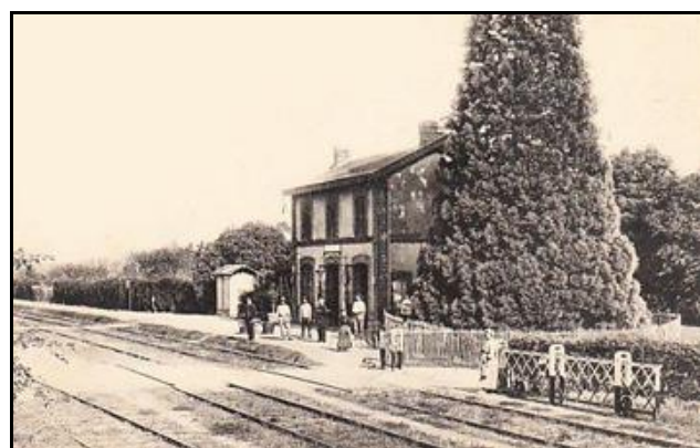
Côté cour et côté voies