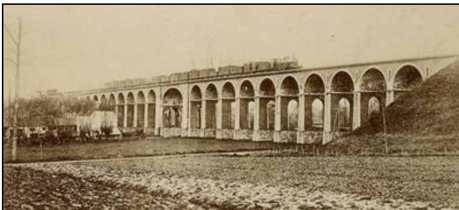
Ci-dessus et ci-dessous, photo générale du viaduc vue par son côté droit et deux autres vues de ce même côté prises dans le sens de la ligne et à contresens