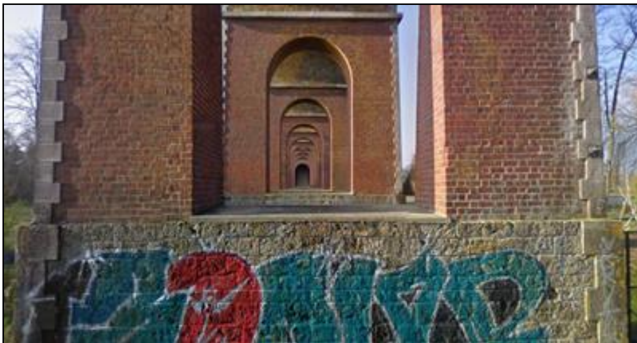
Ci-dessus et ci-dessous, l'enfilade des piles vue à travers les jours