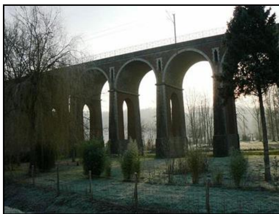
Ci-dessus et ci-dessous, détail des arches ajourées et de leurs assises en pierre de taille