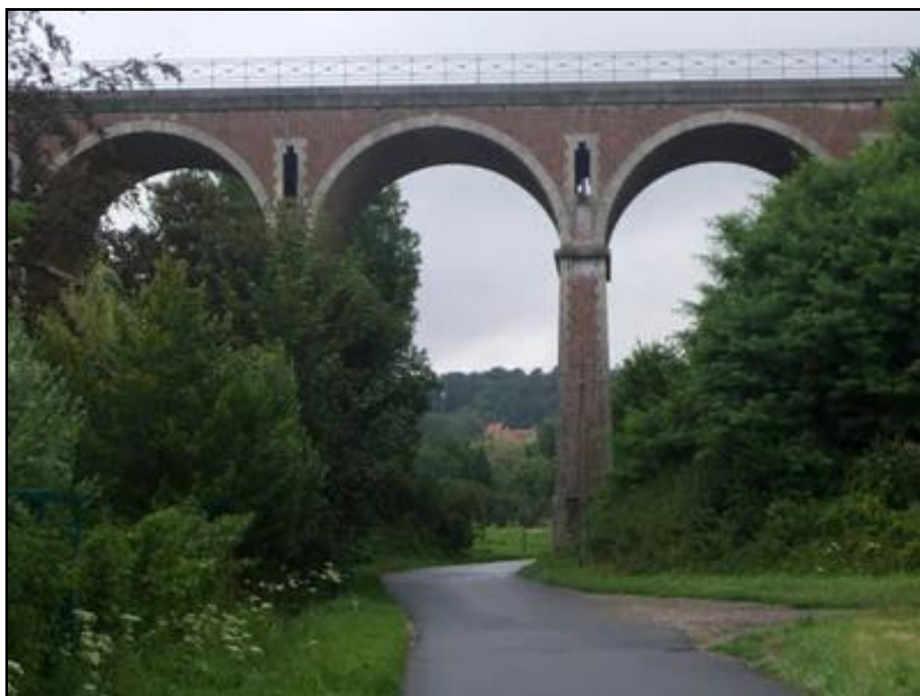
Cette photo laisse voir que les tympans sont creux et que le jour passe à travers les meurtrières