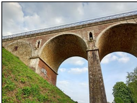
A gauche, photo d'époque montrant la zone affaissée et la première arche du viaduc renforcée A droite, le début du viaduc aujourd'hui