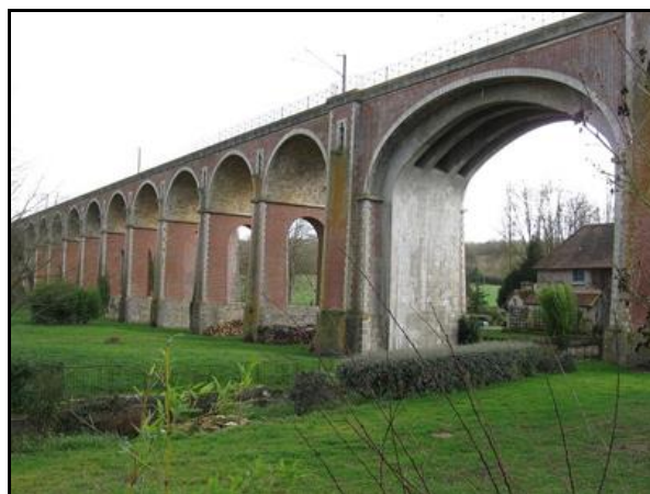
Vue par son côté gauche, la grande arche avec ses renforts bien visibles