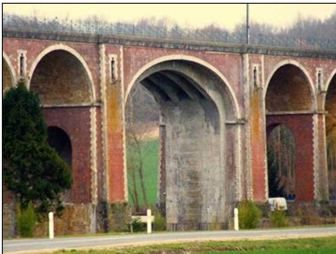
L'arche centrale et ses cintres de renfort