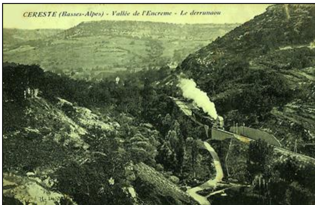
Un train montant vers Céreste franchit le pont

Aussi appelé pont de la Grand Vigne, ouvrage métallique dont le tablier a été retiré après abandon de la ligne et dont il ne reste que deux poutrelles et les culées qui soutiennent une canalisation.