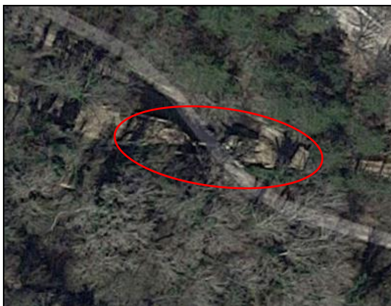
Vue aérienne actuelle des vestiges du pont