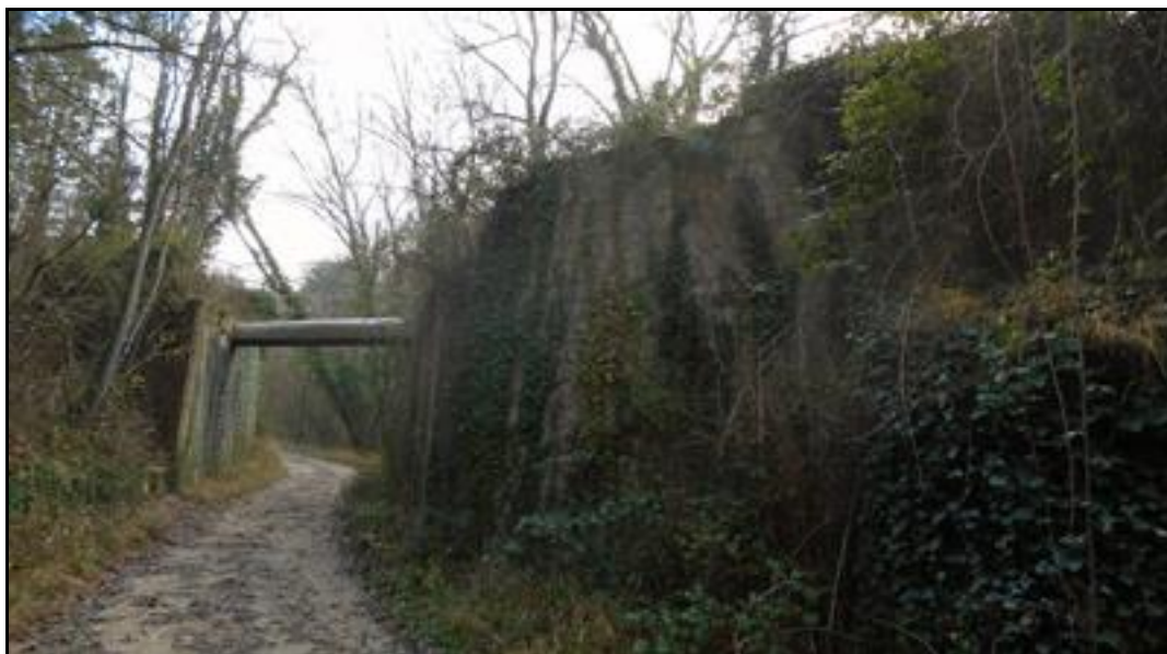
Le pont avec le tuyau qui traverse sa coupure

Le pont vu par ses deux côtés Sa première culée est à gauche sur la photo ci-dessous