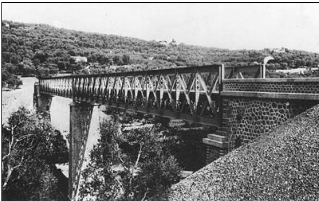
Gros plan sur tablier avec ses poutres latérales ajourées en treillis