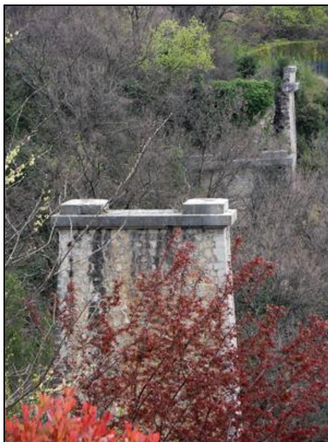
La pile centrale et l'une des culées en arrière-plan

Si cette fiche comporte des erreurs ou des oublis, merci de nous le signaler.