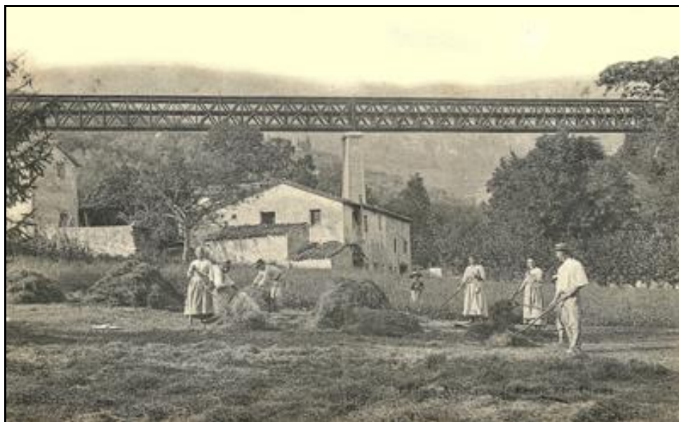
Deux rares photos anciennes de l'ouvrage : les cueilleurs de jasmin sous le viaduc

Le viaduc des Ribes, sur la ligne métrique du Central Var, était un ouvrage comportant deux travées métalliques en treillis, de 60 m de long, reposant sur une pile centrale en maçonnerie. Malgré une tentative de dynamitage opérée par les Allemands en août 1944 suite au débarquement allié sur les côtes de Provence, il résistera. Malgré l'espoir de le préserver et de le reconverter à un usage routier, d'autres grands ouvrages ayant été détruits et la reconstruction de la ligne n'étant pas envisagée, son tablier sera en fin de compte ferrailé en 1952. Il n'en reste que les culées et la pile centrale, toujours visible aujourd'hui au milieu du vallon des Ribes.