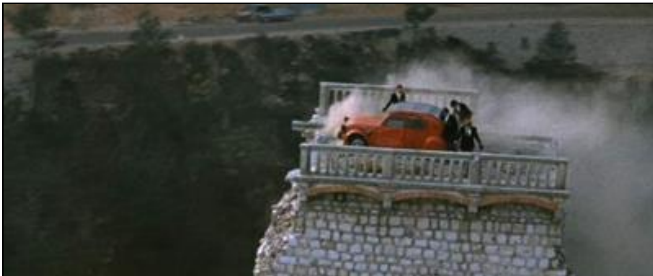
Le moment où la pile saute dans la dernière scène du film

Détruit par les Allemands le 27 août 1944 suite au débarquement allié sur les côtes varoises, seule une pile centrale est restée intacte au milieu de la vallée. Ce vestige devenant dangereux, il a été décidé de le dynamiter à son tour en mars 1966. Mais, originalité finale, cette destruction a donné une idée au réalisateur de films Georges Lautner et qui a profité de cette destruction dans le tournage du film "Ne nous fâchons pas" avec Lino Ventura et Jean Lefebvre. Lors de la dernière scène du film, on voit la voiture des malfrats bloquée sur le pilier pendant quelques secondes avant que l'explosion ne mette fin à la double histoire du viaduc et du film.