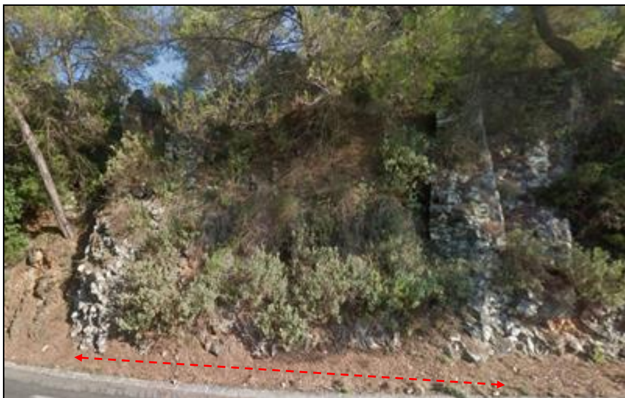
Au bord de la RD 2 qui passe juste en dessous, les restes de la culée nord qui montrent encore la largeur de l'ouvrage

Aujourd'hui, seules les deux culées de l'ouvrage sont encore visibles. La culée nord, côté Vence est très abîmée mais montre encore quelques pierres.