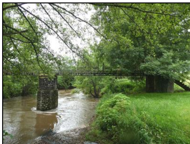
Le début et la fin de l'ouvrage