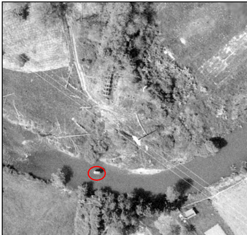
Vue aérienne de la pile du pont au milieu de la rivière

Après fermeture de la ligne, les travées ont été démontées et il ne restait plus que les culées et la pile centrale qui supportent aujourd'hui une passerelle piétonnière.