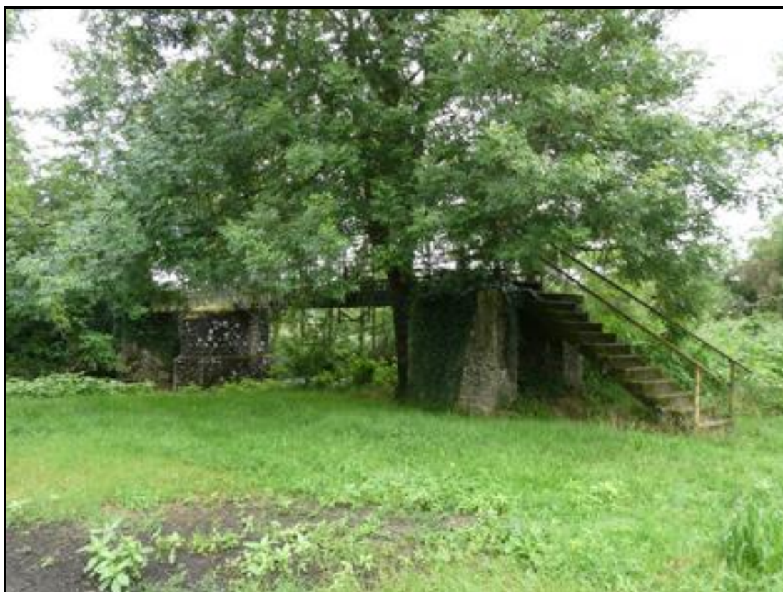
Le pont avec sa dernière culée au premier plan