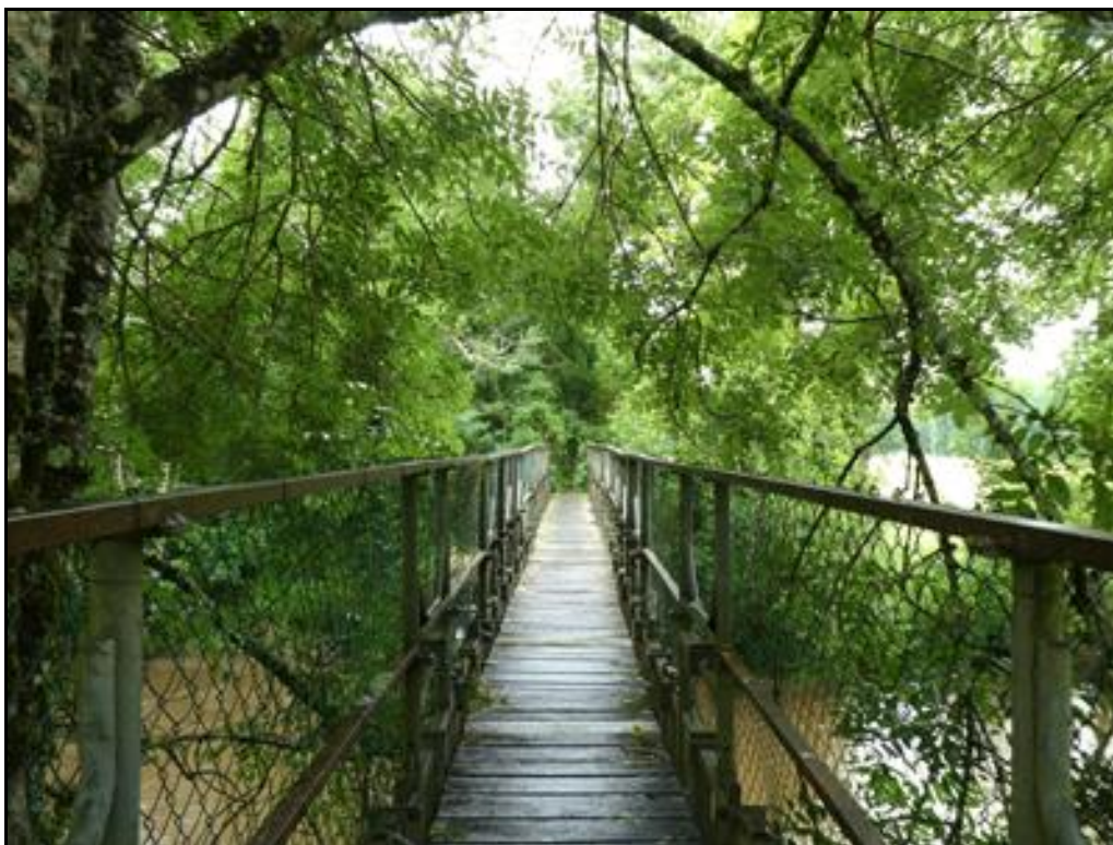
La passerelle piétonnière qui remplace aujourd'hui l'ancien tablier ferroviaire

Si cette fiche comporte des erreurs ou des oublis, merci de nous le signaler.