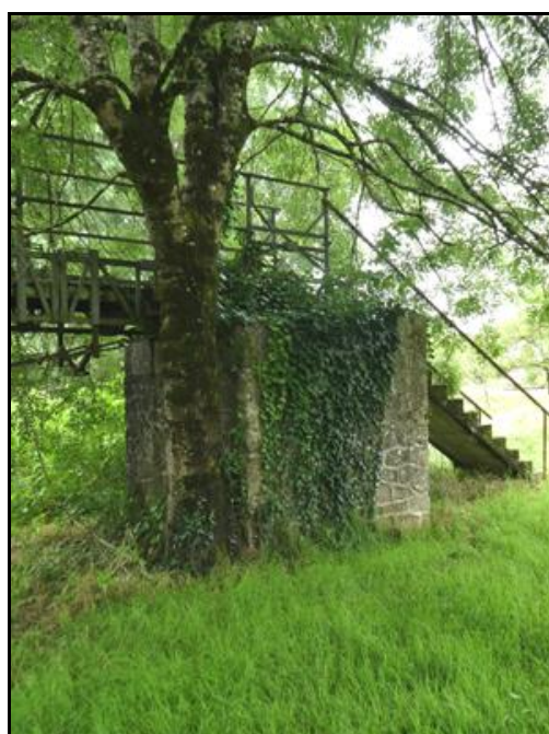
Ci-dessus et ci-dessous, la première et la dernière culées, et la pile centrale