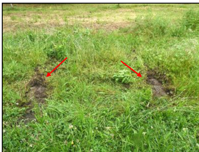
La carcasse du pont, du temps où elle existait encore ; et les traces des résiduelles des plots en béton