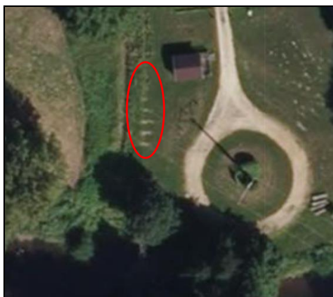
A gauche, vestige du tablier métallique en partie démantelé avant enlèvement A droite, traces des bases des piles du pont