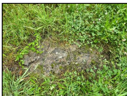
Ci-contre et ci-après, diverses traces des piles encore visibles