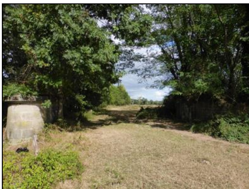
L'emplacement de la deuxième travée la pile centrale à gauche et la deuxième culée à droite