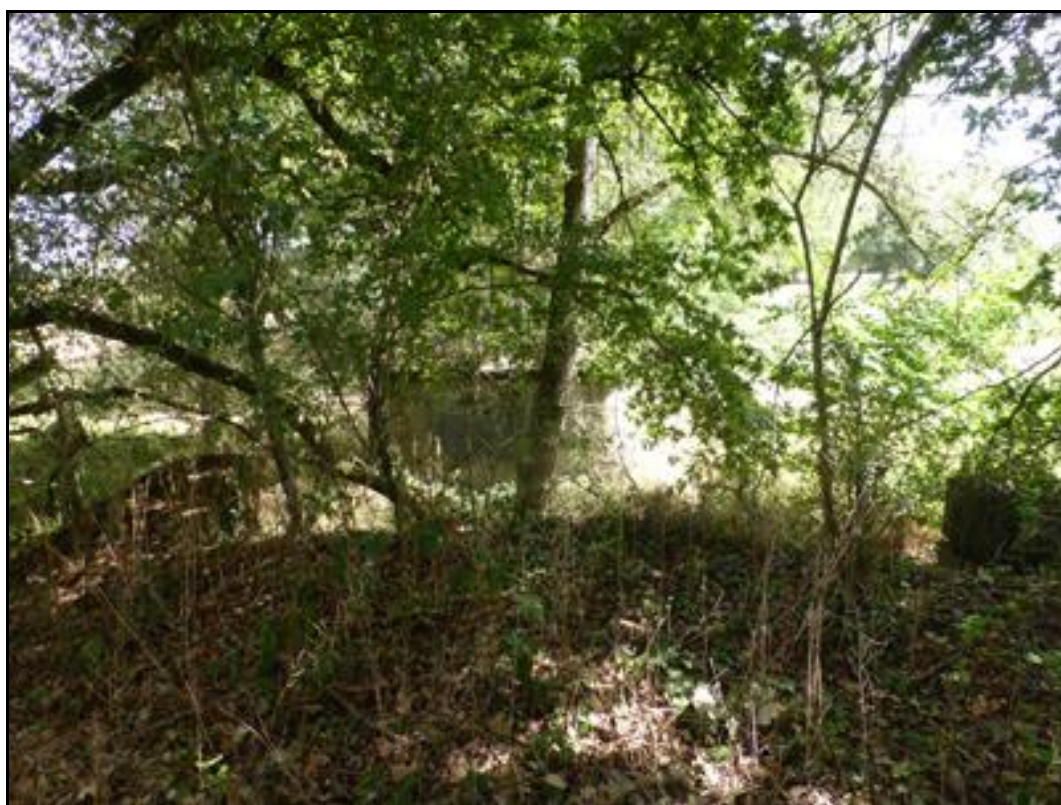
La coupure du pont vue depuis le dessus de la première culée

Si cette fiche comporte des erreurs ou des oublis, merci de nous le signaler.