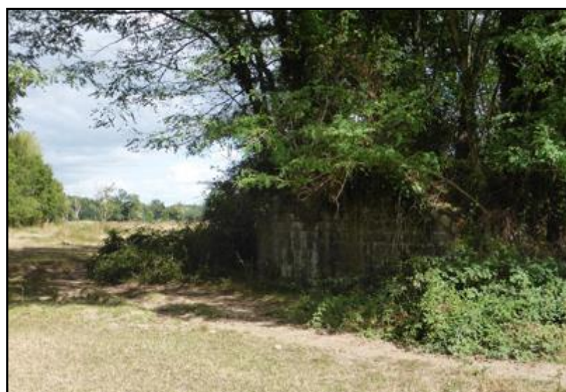
Ci-dessus et ci-après, la deuxième culée