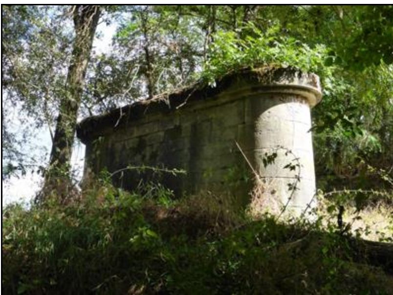
Ci-dessus et ci-après, la pile centrale