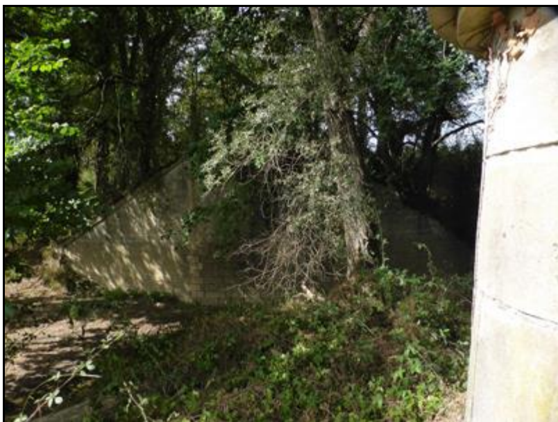
Ci-dessus et ci-dessous, la première culée