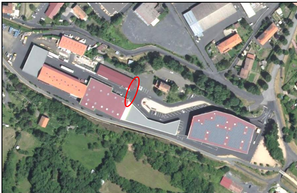
L'emplacement de la perpendiculaire de manœuvre aujourd'hui A comparer avec la photo aérienne de la page précédente

Comme nombre de gares de cette époque, celle de Brives Charensac avait un trafic fret important. Raison pour laquelle elle était équipée d'une voie perpendiculaire de manœuvre pour passer les wagons de marchandises d'une voie sur l'autre. Cet équipement a disparu lorsque la ligne Le Puy en Velay > Langogne a été fermée et défermée. Par ailleurs, les emprises de la gare ont été totalement modifiées et reconverties à des fins industrielles.