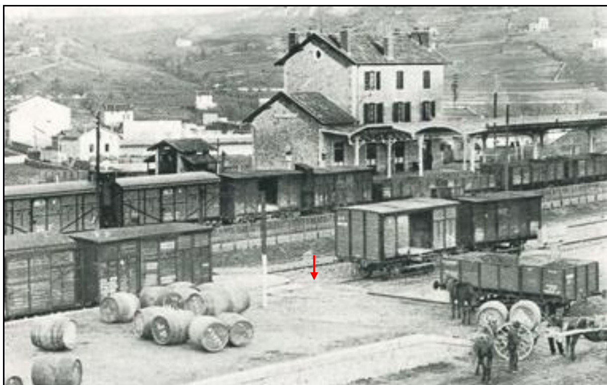
La perpendiculaire de manœuvre et l'une de ses plaques tournantes (flèche)

Si cette fiche comporte des erreurs ou des oublis, merci de nous le signaler.