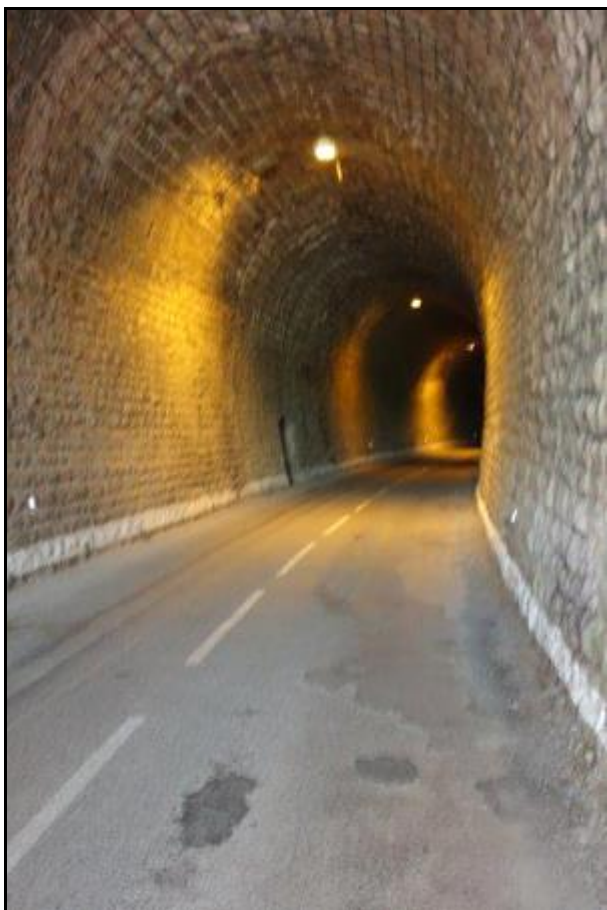
La galerie éclairée du tunnel