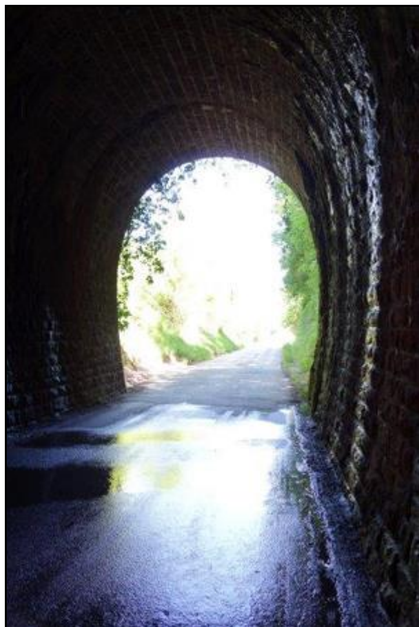
Et la sortie vue de l'intérieur

Si cette fiche comporte des erreurs ou des oublis, merci de nous le signaler.