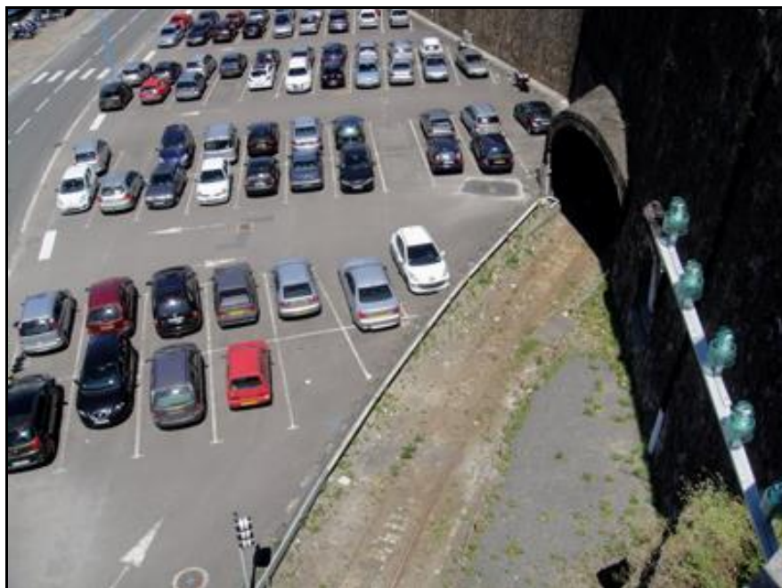
Gros plan sur l'entrée du tunnel

Quelqu'un a pris mon visage. Qui prendra mon derrière ?