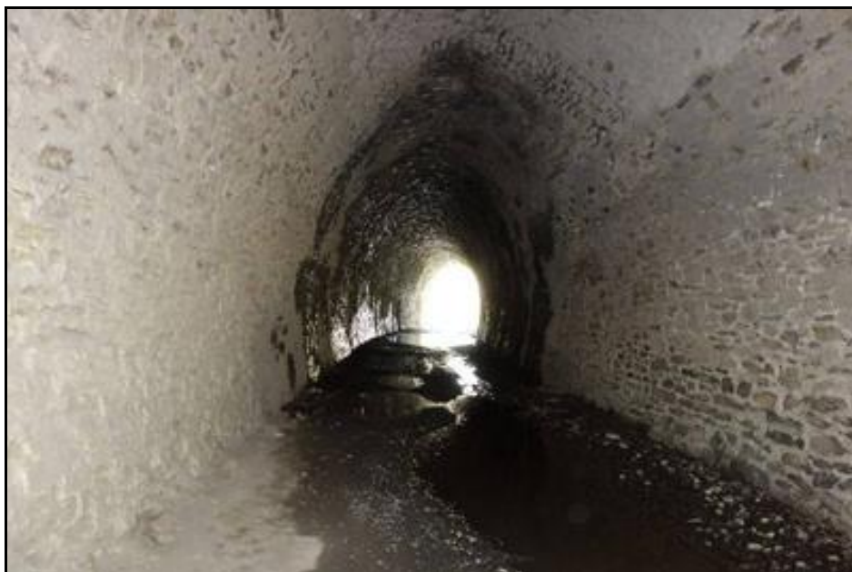
La galerie assez humide du tunnel