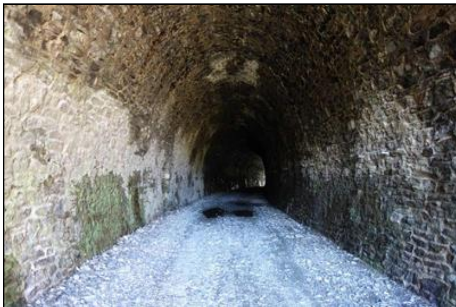
La galerie du tunnel