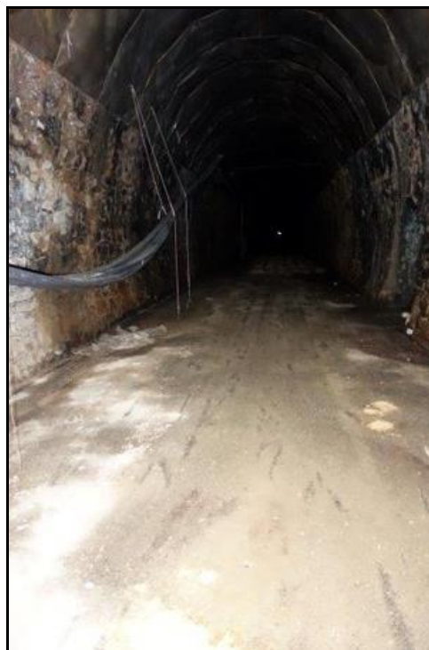
Ci-dessus et ci-dessous, les vestiges de la champignonnière