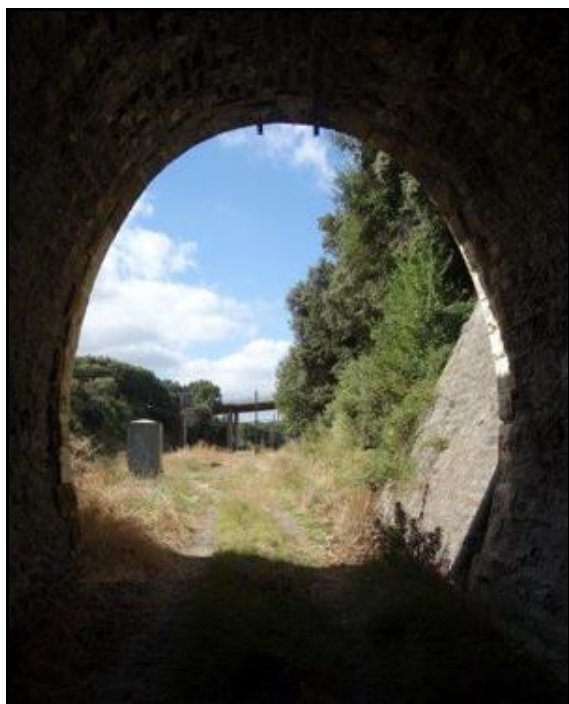
Ci-contre, l'entrée vue de l'intérieur