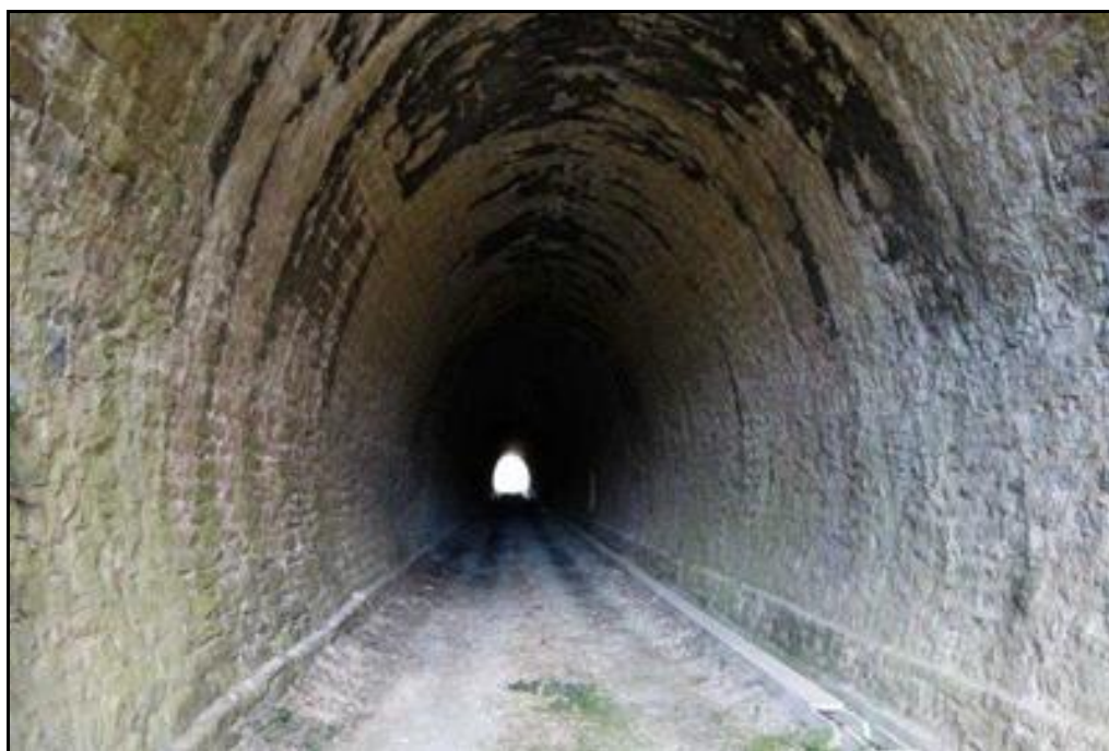
La belle galerie de la tranchée couverte qui livre aujourd'hui passage à un chemin de service

Si cette fiche comporte des erreurs ou des oublis, merci de nous le signaler.