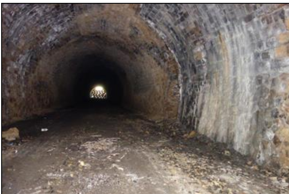
L'approche de la sortie murée