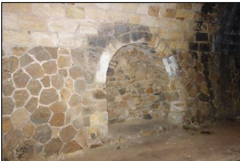
Une niche quelque part dans la galerie

Si cette fiche comporte des erreurs ou des oublis, merci de nous le signaler.