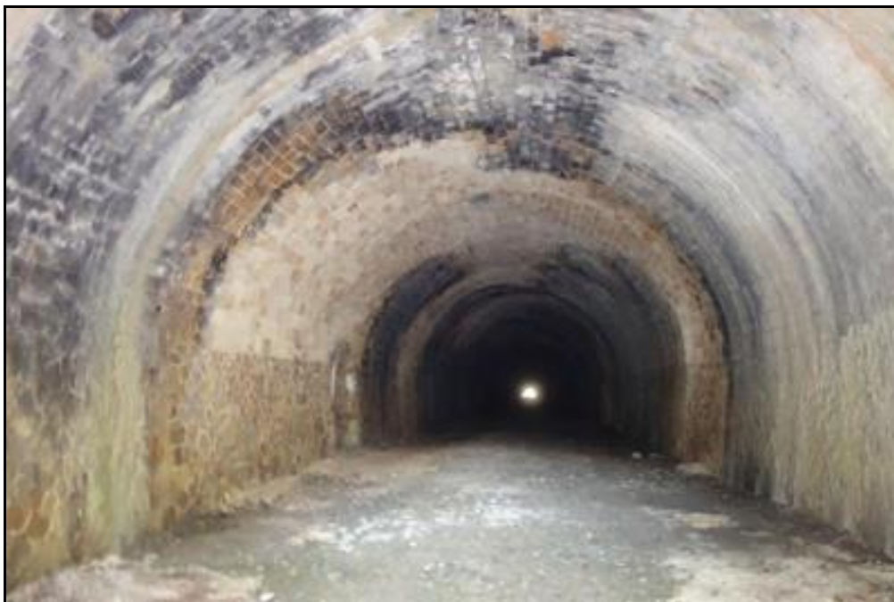
Ci-dessus et ci-dessous, diverses vues de la belle galerie double voie du tunnel