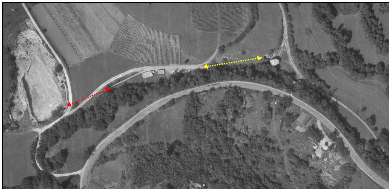
Vue aérienne des deux tunnels de Serpollet A droite, le tunnel n° 1 et à gauche, le tunnel n° 2

Petit tunnel de l'embranchement minier qui desservait la carrière de Serpollet. Il a été bouché et a disparu après fermeture de la carrière.