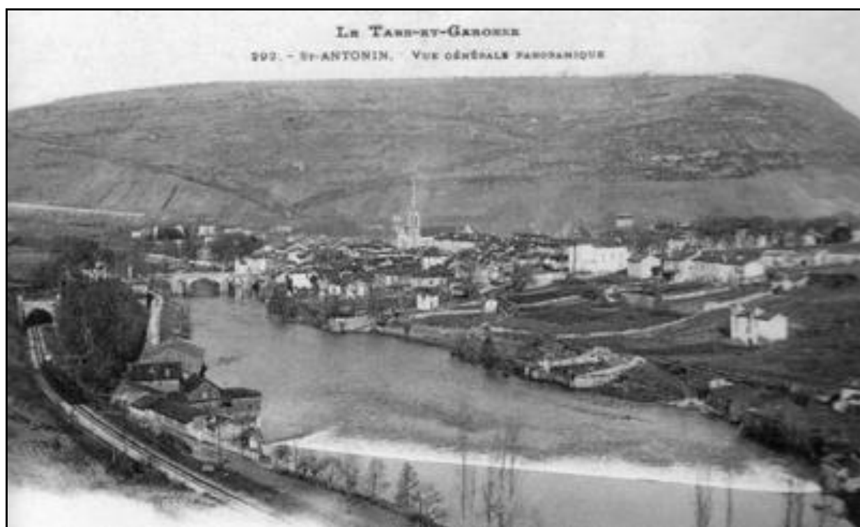
Vue panoramique de Saint Antonin Noble Val faisant apparaître l'entrée du tunnel à gauche

Si cette fiche comporte des erreurs ou des oublis, merci de nous le signaler.