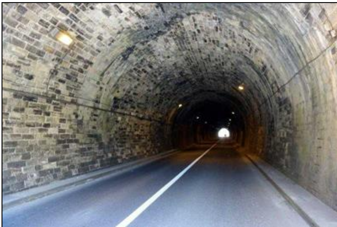
La galerie éclairée du tunnel