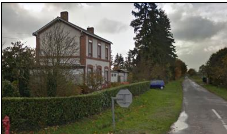
Ci-dessus et ci-dessous, deux vues de la gare de Luzanger, côté voies