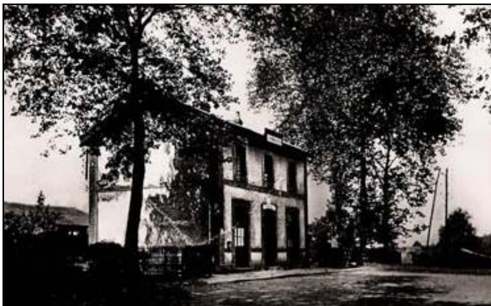
Ci-dessus et ci-dessous, côté cour et côté voies, hier, la gare de Derval