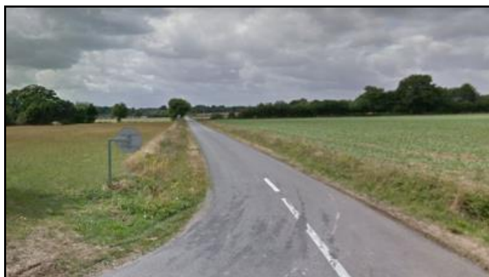
Ci-dessus et ci-contre, deux aspects de la petite route

Absolument droite et plate, elle n'offre aucune difficulté. Seul reproche que l'on puisse lui faire : le manque d'ombrage.