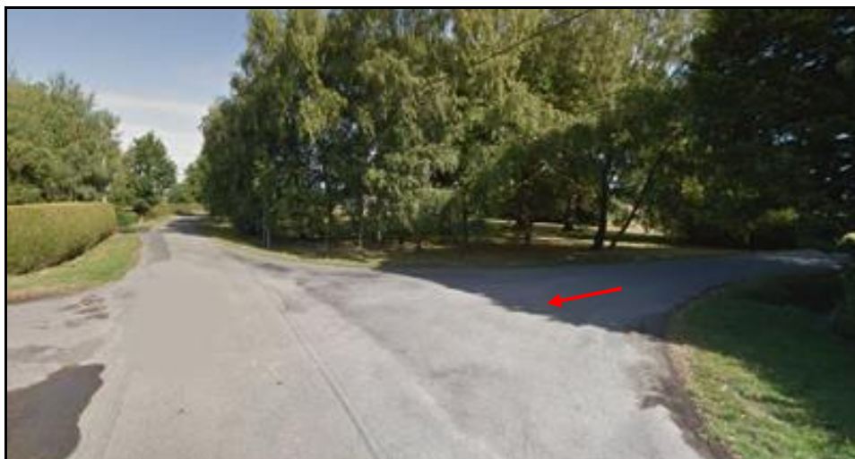
Autre vue de la fin du parcours

Si cette fiche comporte des erreurs ou des oublis, merci de nous le signaler. Aidez-nous à la compléter avec vos photos ; merci d'avance.