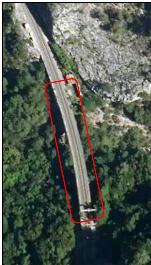
Le viaduc, hier et aujourd'hui