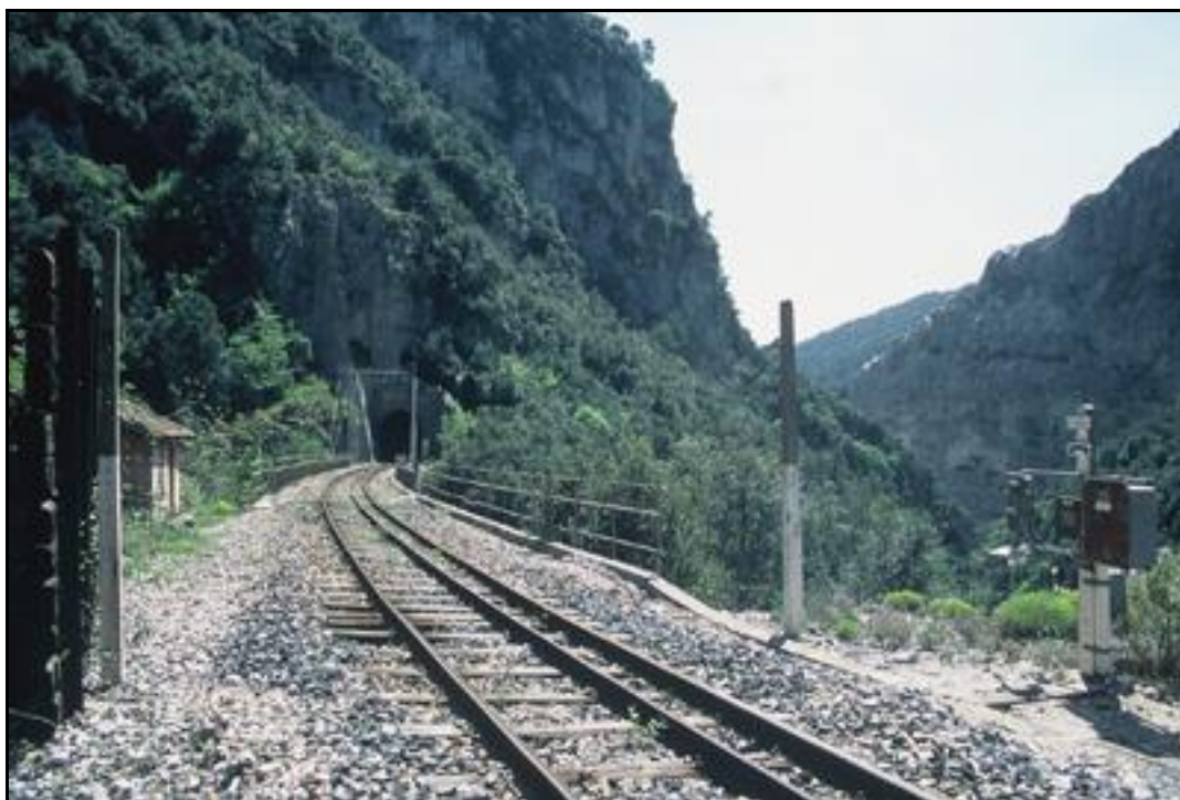
Le tablier du viaduc vu à contresens de la ligne en regardant vers Nice

Si cette fiche comporte des erreurs ou des oublis, merci de nous le signaler.