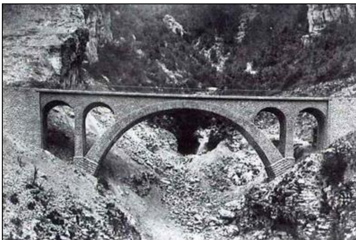
Le viaduc peu après sa finition avec ses deux arches d'extrémités et ses deux élégissements dans les tympans de la grande arche