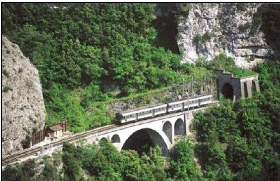
Ci-dessus et ci-dessous, le viaduc aujourd'hui