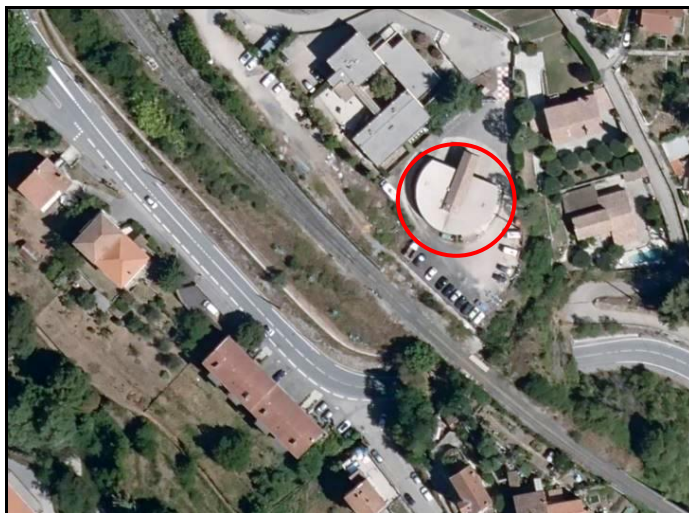
L'emplacement du pont, hier et aujourd'hui