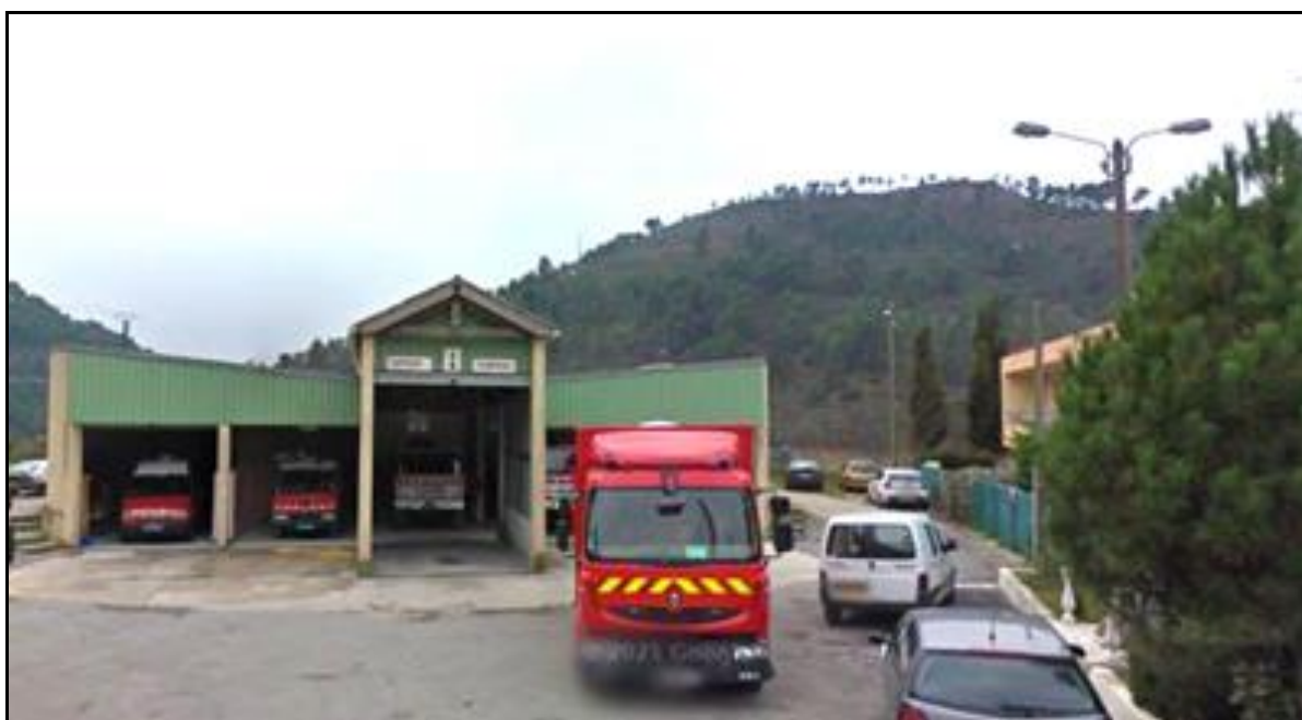
La caserne des pompiers qui occupe l'exacte place de la fosse comblée du pont tournant disparu