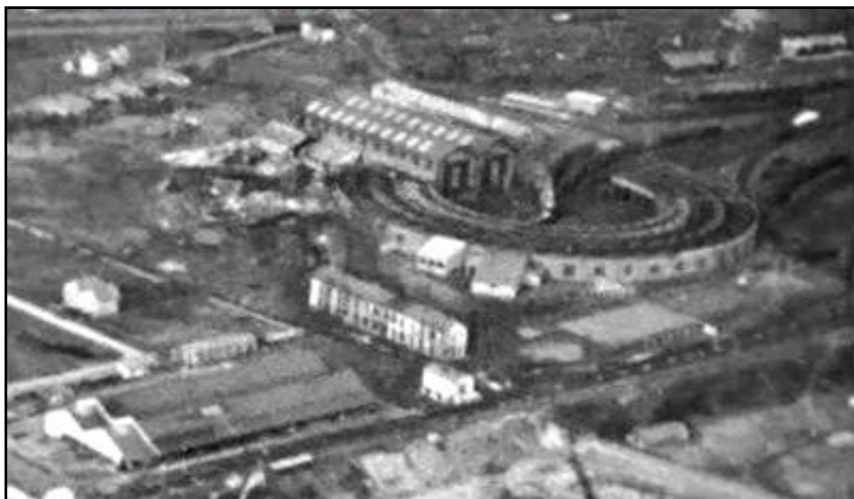
Ci-dessus et ci-dessous, le dépôt rotonde d'Estavel du temps de son existence