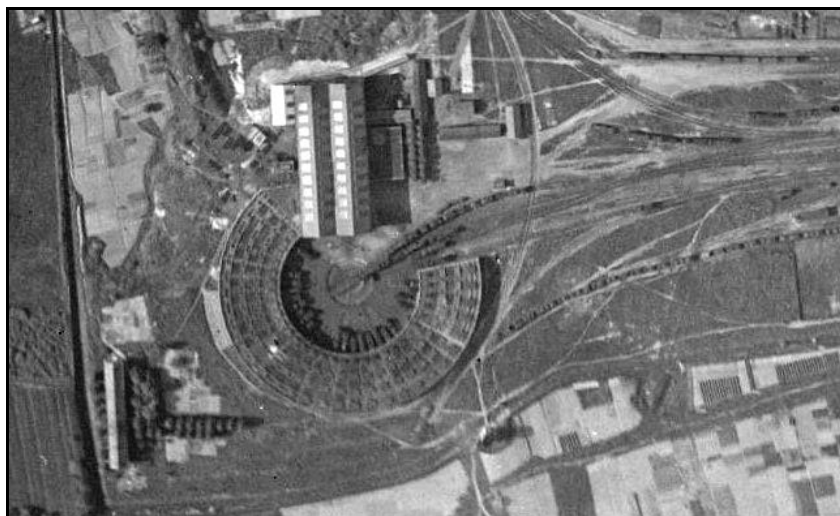
L'emplacement du pont tournant d'Estavel et de sa rotonde, hier et aujourd'hui

Mais avec la disparition de la traction vapeur, ce dépôt va être peu à peu désaffecté et la rotonde sera amputée des deux tiers de sa surface initiale avant sa destruction finale et définitive en 2013 pour laisser place à de nouveaux ateliers d'entretien de matériels de chantier spéciaux. Par contre, le pont tournant survivra et est toujours en service. Il dessert des voies de remise circulaire en plein air.