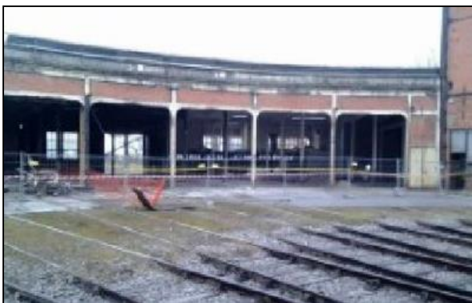
La rotonde abandonnée peu avant sa destruction finale