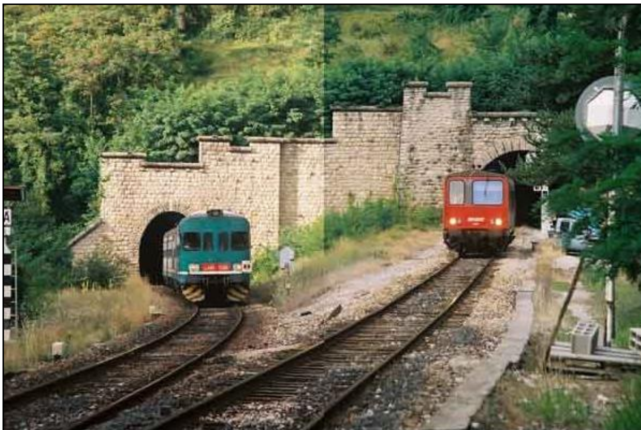
Deux trains venant du sud arrivent en gare de Breil sur Roya A gauche, remontant de Vintimille, un train Italien qui va continuer la ligne vers Tende et Cuneo A droite, arrivant de Nice et Sospel, un autorail français sort du tunnel de Carança pour faire la correspondance

Si cette fiche comporte des erreurs ou des oublis, merci de nous le signaler.