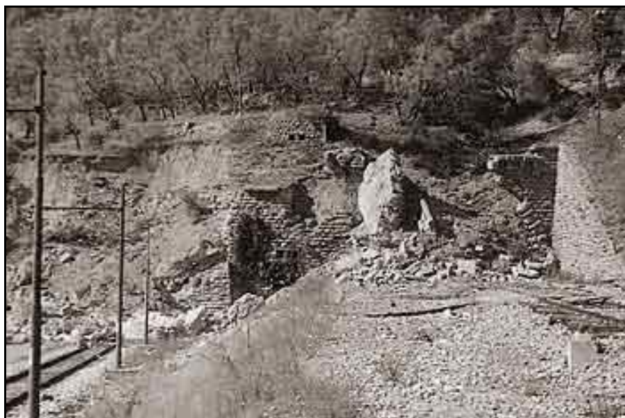
Les deux têtes des tunnels détruites par les Allemands pendant la Seconde Guerre mondiale

Dans les faits, les diverses destructions d'ouvrages d'art faites sur la ligne pour empêcher les trains de passer, feront que ces systèmes défensifs n'auront pas à servir. Et vers la fin de la guerre, les Allemands en retraite feront sauter les têtes des deux tunnels.