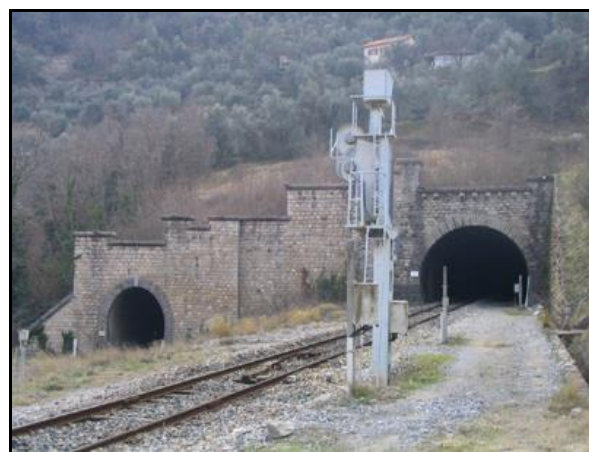
Puis reconstruites après guerre

A noter que la sortie du tunnel de Carança sera reconstruite très rapidement pour rétablir le trafic avec Breil, alors que l'entrée du tunnel de Gigne ne sera rétablie qu'en 1974.