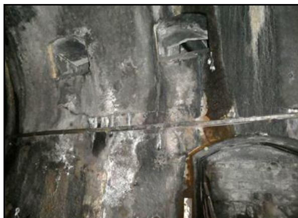
Créneaux de tir vus depuis l'intérieur du système de défense et depuis la galerie du tunnel

Dans les faits, les diverses destructions d'ouvrages d'art faites sur la ligne pour empêcher les trains de passer, feront que ces systèmes défensifs n'auront pas à servir. Et vers la fin de la guerre, les Allemands en retraite feront sauter les têtes des deux tunnels.