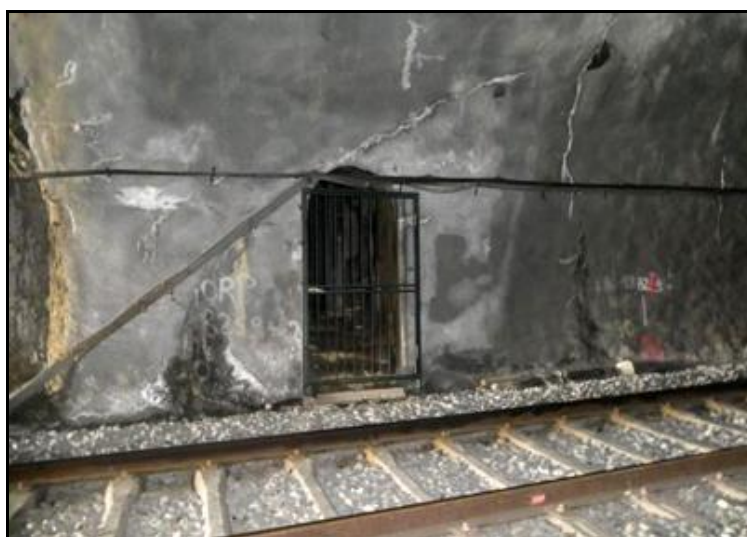
Entrée du système de défense côté Carança

En raison de la proximité de la frontière, il était prévu que les deux ouvrages soient équipés d'un système de défense souterrain La petite galerie entre les deux tunnels servait d'accès au chantier de ces défenses souterraines Par ailleurs, on voit des embrasures de tir à gauche de la sortie du tunnel de Carança