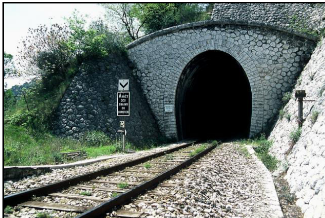
L'entrée du tunnel en sortie de gare de Drap et Cantaron