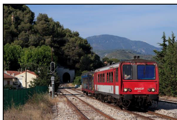
Ci-dessus et ci-dessous, divers types de matériels roulant sur cette ligne, sur fond de l'entrée du tunnel La rame en bas à droite est italienne et remonte vers Cunéo