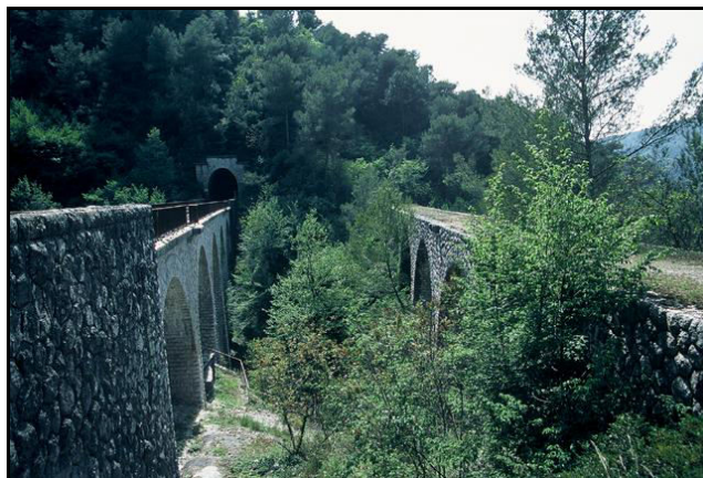
Sortie du tunnel et vue du viaduc abandonné correspondant à l'ancien tracé de la ligne

Si cette fiche comporte des erreurs ou des oublis, merci de nous le signaler.