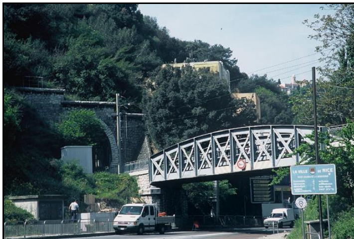
Autres vue de l'accident, du pont et de la sortie du tunnel

Si cette fiche comporte des erreurs ou des oublis, merci de nous le signaler.