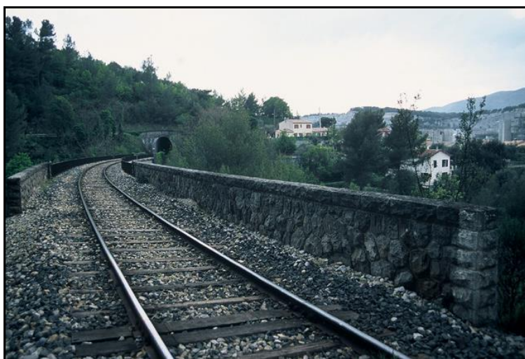
La sortie du tunnel à l'extrémité du viaduc de la Colletta

Quelqu'un a pris mon visage. Qui prendra mon derrière ?