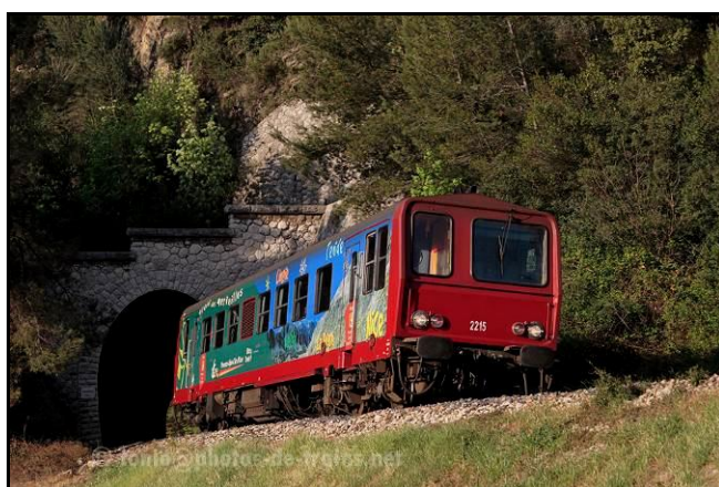
Autorail montant vers Breil sur Roya, au sortir du tunnel de Serradone

Si cette fiche comporte des erreurs ou des oublis, merci de nous le signaler.